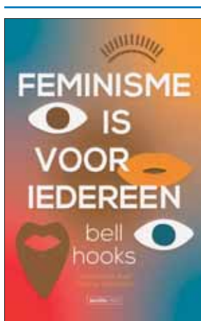
bell hooks, Feminisme is voor iedereen , Zutphen: Mazirel Pers, 2022

van Badinter, Dehue en Berger. Daarmee tonen zij aan dat wat we nu als vanzelfsprekend beschouwen, eigenlijk een historisch construct is dat een bepaalde agenda dient. Hedendaags feminisme is daarom voor iedereen: man en vrouw, cis en trans, mens en dier, wit en zwart, arm en rijk. Hoewel auteurs als Badinter en hooks dit geluid decennia geleden al lieten horen, is het nu gemeengoed in het werk van feministische auteurs. Feministische stromingen die geen oog hebben voor systemische factoren en intersectionaliteit, hebben afgedaan. Wat dat betreft kunnen we wel degelijk spreken van een nieuw zwaartepunt in de feministische discussie, en daarmee van een nieuwe golf.