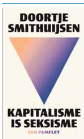
Doortje Smithuijsen, Kapitalisme is seksisme. Een pamflet , Amsterdam: Podium, 2024