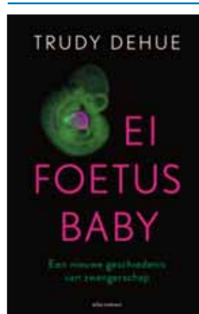
Trudy Dehue, Ei, foetus, baby. Een nieuwe geschiedenis van zwangerschap , Amsterdam: Atlas Contact, 2023