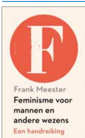
Frank Meester, Feminisme voor mannen en andere wezens. Een handreiking , Utrecht: Ten Have, 2023