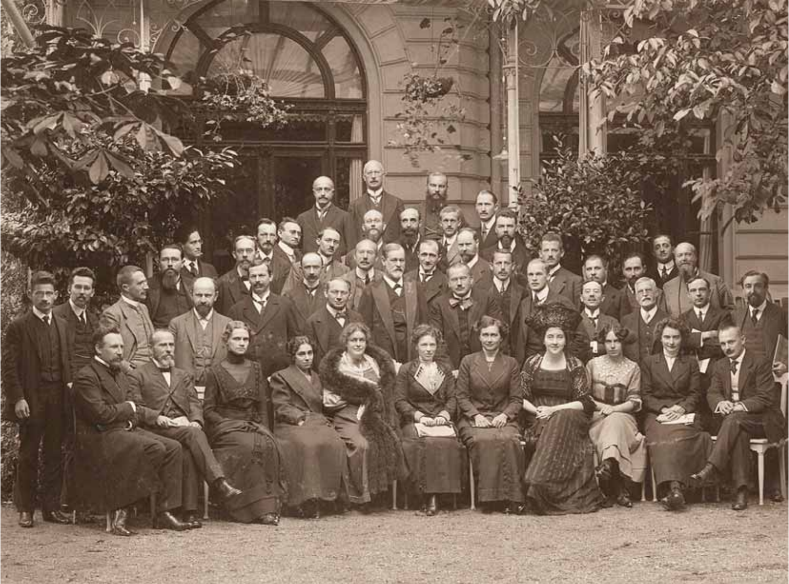
Het Internationale Psychoanalytische Congres in Weimar, 1911, met op de tweede rij als tweede van links Ludwig Binswanger en in het midden Sigmund Freud.

worden van de tijdigheid van het bestaan en daardoor andere prioriteiten stellen. Ook kan het een angst voor verlies teweegbrengen. Het oude wereldontwerp maakt dan plaats voor een nieuw wereldontwerp. Het idee dat ieder zo een wereldontwerp heeft, en dat zo'n wereldontwerp ook een andere vorm kan aannemen, maakt dat we de gekte niet meer zo sterk van onszelf afscheiden. Dit heeft verregaande consequenties voor de manier waarop er met de 'gekte' wordt omgegaan. De geesteszieke kan namelijk niet zomaar gereduceerd worden tot ding – tot het zijn van een ziektebeeld: 'de schizofreen', 'de autist' – zoals de hedendaagse diagnostiek lijkt te doen. Dit soort reducties zorgen ervoor dat de menselijkheid van de 'gek' wordt gescheiden. Omdat het onderstrepen van het wereldontwerp zulke reducties niet toelaat, vormt Van Buurens werk hier een krachtig tegengeluid tegen.